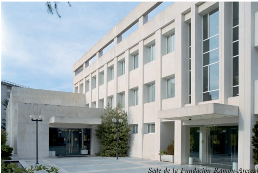
Sede de la Fundación Ramón Areces